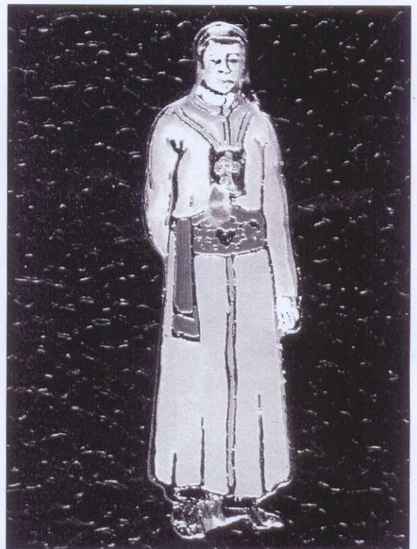
Al natural, los portapasos de la Piedad somos más graciosos que el del pin.

Lo más gracioso fue cuando, al salir de la iglesia, vemos que el novio y la novia ya han llegado y nos están esperando, aún más asombrados que sus invitados. Felicitamos a los novios, y nos comprometemos a repetirlo este año de 1996. Nos alegró y emocionó a todos.